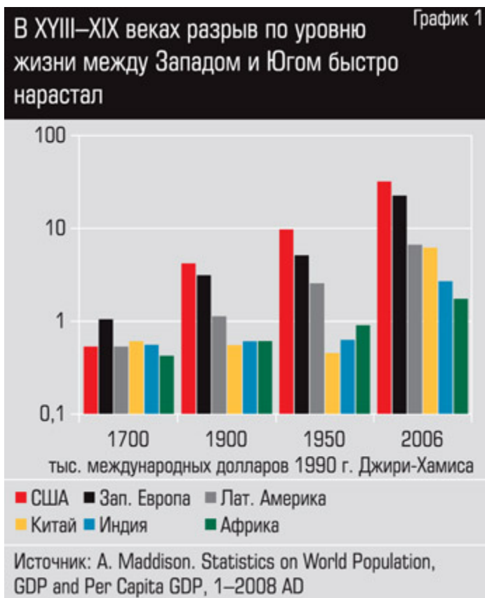
График 1. В XVIII–XIX веках разрыв по уровню жизни между Западом и Югом быстро нарастал

С середины XX века другая, восточноазиатская, модель экспортноориентированного догоняющего развития позволила ряду стран догнать Запад и фактически превратиться из развивающихся в развитые. Япония, Южная Корея, Тайвань, Сингапур, Гонконг — все они впервые вошли в клуб богатых стран.