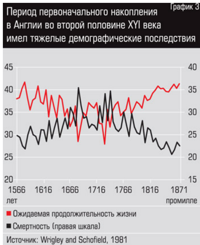
График 3. Переход первоначального накопления в Англии во второй половине XVI века имел тяжелые демографические последствия

Но и переориентация всей экономической машины с потребления на накопление стала, несомненно, крупнейшим социальным изменением за тысячелетия. Ведь прежде, до XVI века, доля сбережений и инвестиций в ВВП еле доходила до 5% и была едва достаточна для возмещения изношенного основного капитала, создания новых рабочих мест для растущего населения. В Корее и Индии даже в начале XX века доля сбережений все еще была на уровне 4–7% ВВП. В 1870–1899 годах в Австралии, Канаде, Японии, Великобритании норма сбережений составляла всего 9–14% ВВП.