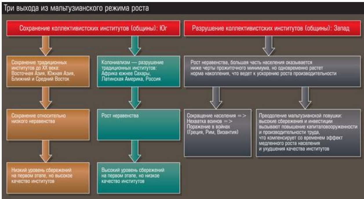
Схема. Три выхода из мальтузианского режима роста

Кардинальное перераспределение собственности (земли) в Англии и отсутствие такого перераспределения в Китае доказывают данные о величине фермерских хозяйств: в Британии их средний размер вырос с 14 акров в XIII веке до 75 акров в 1600–1700 годах и до 151 акра в 1800-м, тогда как в Китае он снизился с 4 акров в 1400 году до 3,4 акра в 1650-м и до 2,5 в 1800-м (в дельте Янцзы — с 4 в 1400-м до 2 в 1600–1700 годах и до 1 в 1800-м). В Китае растущему сельскому населению предоставлялась земля за счет существующих владельцев; в Англии, напротив, фермеры сгонялись с земли и превращались в пролетариев. Доля городского населения в Англии повысилась с 6% в 1600 году до 13% в 1700-м и 24% в 1800-м, тогда как в Китае она сократилась более чем с 20% в XIII веке всего лишь до 5% (!) в начале XIX.